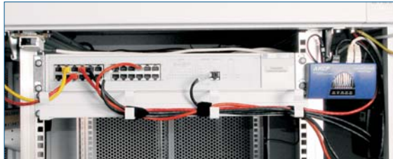
Abb.: sensorProbe2 Vor-Ort im Einsatz. Dank ihrer kompakten Bauweise ist sie fast überall zu installieren. Ihre Infrastruktur ist somit wirksam geschützt.

Der Anschluss der Sensoren an die sensorProbe2 ist denkbar einfach: Dank der Autosense-Funktion der sensorProbe2 wird der Sensor sofort erkannt und das Monitoring startet. Sie müssen nur noch die Schwellwerte in der leicht bedienbaren Web-Oberfläche der sensorProbe2 eingeben und definieren, ob Sie per eMail, SMS (per SMS-Server) oder durch die SNMP Traps benachrichtigt werden möchten. Schon sind Sie gegen unerwartete Ereignisse gewappnet.