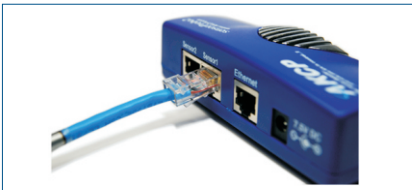
Abb.: Das Cat5-Kabel des Bewegungsmelders wird einfach in einen freien RJ45- SensorPort des sensorProbe2 Monitoringsystems gesteckt und per AutoSense-Funktion automatisch identifiziert. Am zweiten Port können Sie beispielsweise die AlarmSirene mit Stroboskop anschließen, welche mit dem Bewegungsmelder in Interaktion treten kann.

Abb.: Unternehmenskritische Infrastrukturen wie z.B. Serverraum, Archiv, Warenlager usw. sollten vor unbefugtem Zutritt geschützt werden. Auch unbemannte Lokationen in Niederlassungen können mit den IP-fähigen Bewegungsmeldern für sensorProbe und securityProbe Monitoringsysteme zuverlässig überwacht werden.