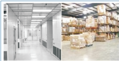
Abb.: Unternehmenskritische Infrastrukturen wie z.B. Serverraum, Archiv, Warenlager usw. sollten vor unbefugtem Zutritt geschützt werden. Auch unbemannte Lokationen in Niederlassungen können mit den IP-fähigen Bewegungsmeldern für sensorProbe und securityProbe Monitoringsysteme zuverlässig überwacht werden.

Die Montage des Bewegungsmelde-Sensors kann sowohl an der Wand als auch an der Decke erfolgen. Der Bewegungsmelder ist mit einem RJ-45 Anschluss ausgestattet und wird per herkömmlichen Cat5-Kabel an einem freien SensorPort des sensorProbe oder securityProbe IP-Monitoringsystems angeschlossen. Die Spannungsversorgung des Bewegungsmelders erfolgt über das IP-Monitoringsystem. Dank der AutoSense-Funktion wird dieser Sensor automatisch von der sensorProbe oder securityProbe erkannt und im Webinterface angezeigt. Sie müssen nur festlegen, ob Sie bei Bewegungserkennung per E-Mail , SMS oder SNMP-Trap an Ihre Netzwerküberwachungslösung (OpenNMS, Monet, Nagios, WhatsUp Gold, HP OpenView pp.) alarmiert werden möchten. Hervorzuheben ist, dass im Webinterface der sensorProbe und securityProbe Monitoringsysteme ein Zeit- und Wochentagsfilter vorhanden ist, so dass die Alarmgebung bei unbefugtem Zutritt individuell festgelegt werden.